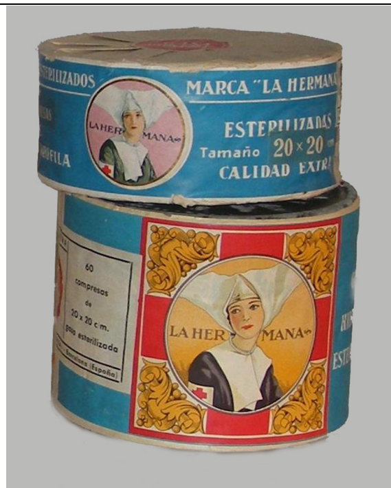
Figura 1. Compresas de gasa hidrófila esterilizada «La Hermana» (c. 1955). Colección de Medicamentos de Fabricación Industrial del Seminario de Historia de la Farmacia de la UAH.

contenido ya indicado y de la representación de una religiosa con cofia blanca y brazaletes con una cruz roja, se indica el fabricante, FRACSA, y el precio de venta al público, pero nada más. No hay ninguna referencia a registro alguno, ni a director técnico que hubiera estado al cuidado de la elaboración.