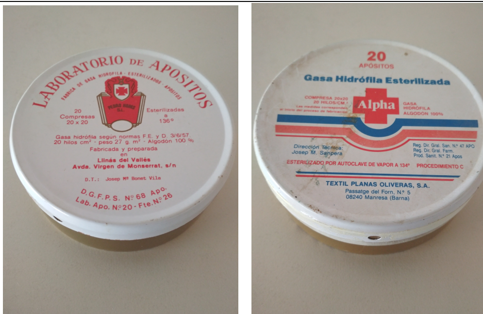
Figuras 4 y 5. Compresas de gasa hidrófila esterilizada «Pedro Homs S.L.» y «Alpha». Colección de Medicamentos de Fabricación Industrial del Seminario de Historia de la Farmacia de la UAH.